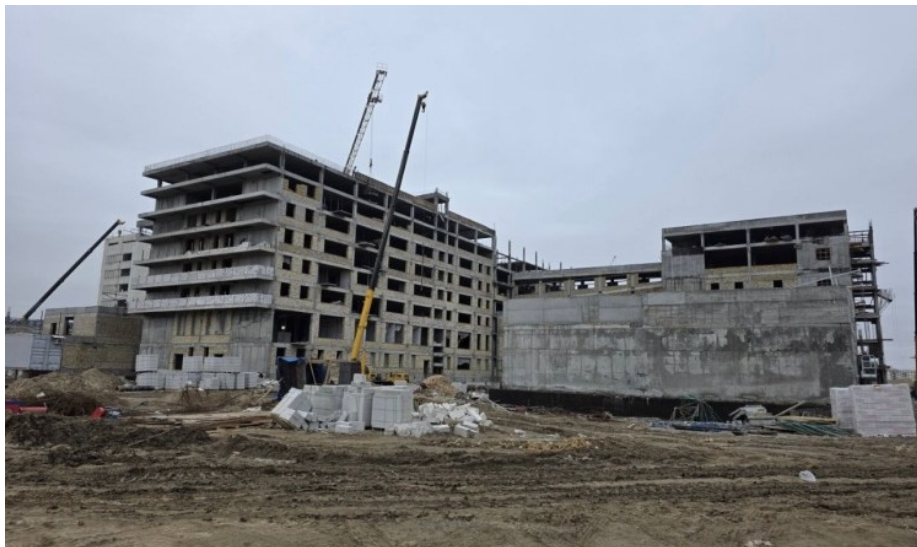
1-сурет – Қызылорда қаласындағы сол жақ жағалаудағы салынып жатқан ғимараттар

Құрылыс конструкцияларының техникалық жай-күйін анықтау үшін зерттеу тек қолданыстағы ғана емес, сонымен қатар ғимараттар мен құрылыстарды салу кезеңіндегі ақауларды анықтау кезінде көптеген мамандардың назарын аударатын маңызды, жауапты және күрделі инженерлік міндет болып табылады [7-8].